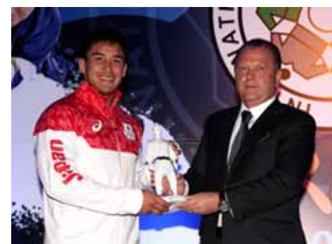
Baker Mashu (JPN) - Olympic Champion - 90kg Mr. Marius Vizer, IJF President

A Nemzetközi Judo Szövetség Rióban gálával ünnepelte győzteseit, valamint az olimpián való sikeres részvételt. A rendezvényen a szövetség elnöke, Mr. Marius Vizer személyesen gratulált a győzteseknek, egyúttal mindannyiuknak egy Herendi szobrot adott át, ami Kano Jigorot, a judo alapítóját ábrázolta.