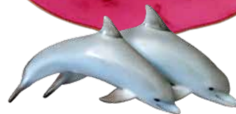
Delfinpár, Feng Shui / 15394000 CD