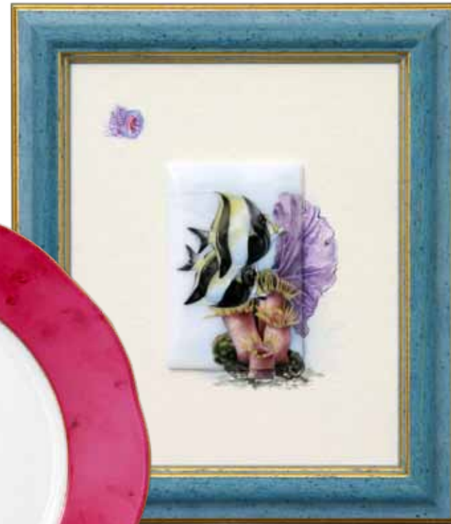
Csemegetányér / 20521000 MEVH4