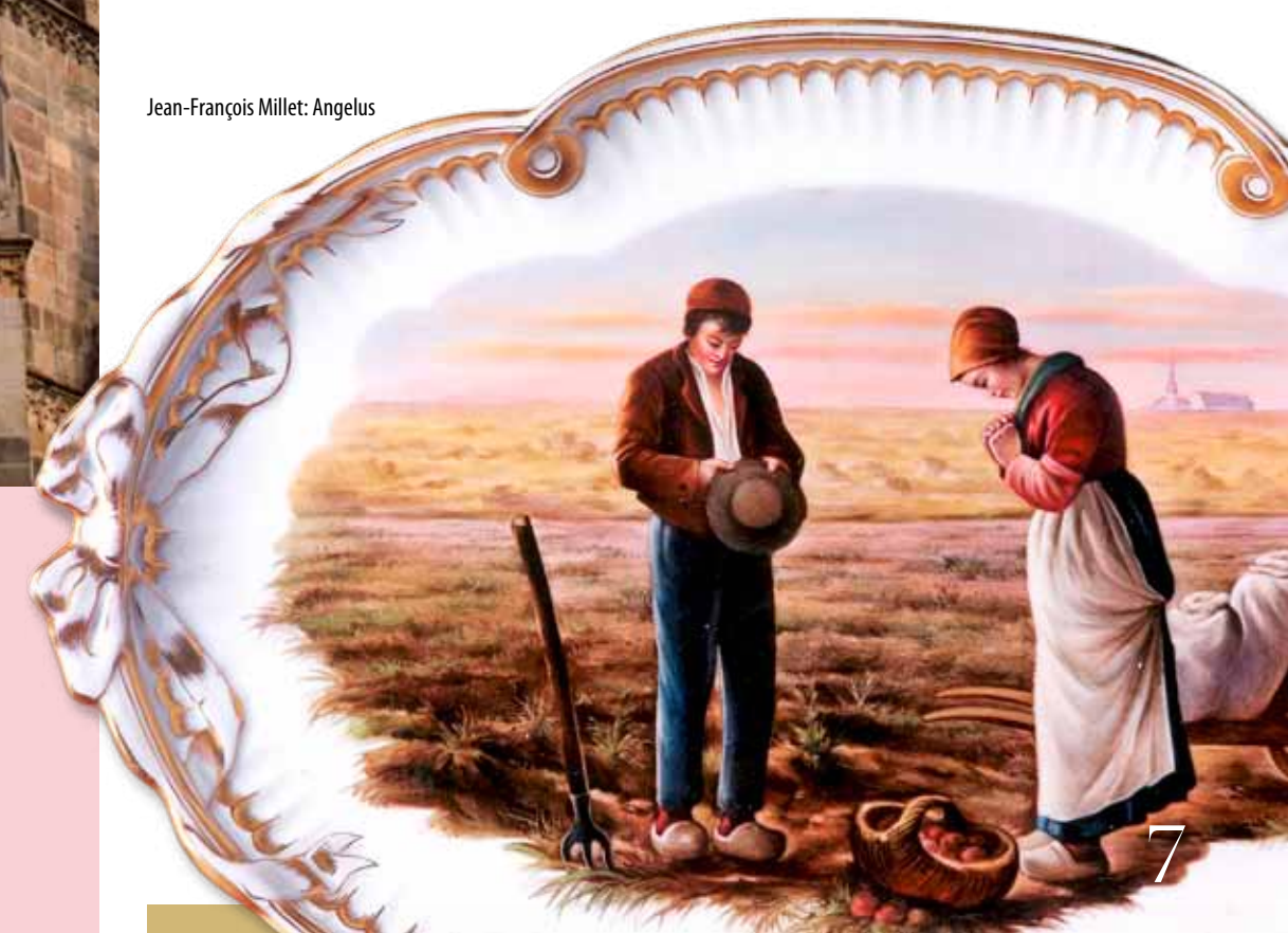
Jean-François Millet: Angelus

A kassai szőlőművesek védőszentjének, Szent Orbánnak harangja zengett a Kassán található Szent Orbán-toronyban, melyet az 1556-os nagy tűzvészben elpusztult kassai harangok töredékeiből 1557-ben öntött Illenfeld Ferenc ágyú- és harangkészítő mester. Dicsőn szól a harangszó évszázadokon át, míg 1966-ban egy tűzvész során a harang leesett és szét tört. Restaurálását követően, 1989-ben helyezték el az eredeti harangot az Orbán-torony lábainak nyugati oldalánál, a földön egy talpazaton. 1999-ben készített pontos mása minden délben megkondul.